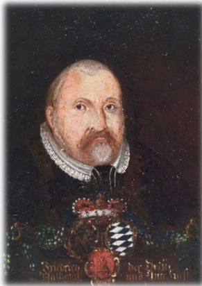
KEURVORS FREDERIK III VAN DIE PALTZ